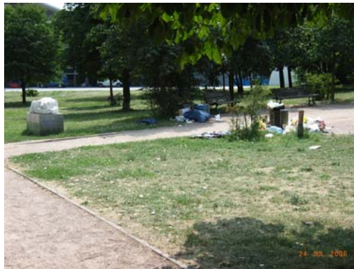
Der Park leidet: Müll & Trockenheit

Ein großer Vorteil wäre die permanente Betreuung der Grünflächen durch Mitarbeiter, die flexibel erforderliche Arbeiten gerade im stark frequentierten Mauerpark (besonders am Wochenende) durchführen können. Die Kiezbezogenheit ist ein wichtiges Kriterium bei der Auswahl der Mitarbeiter. Die Permanenz wäre aber auch für das AUN ein großer Vorteil, da der dauernde Wechsel von ABM-Personal und die nicht stattfindende Qualifizierung sowie der eigene Personalabbau Probleme bei der Pflegequalität aufwirft.