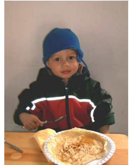
Auf die Löffel! Fertig! LOS!