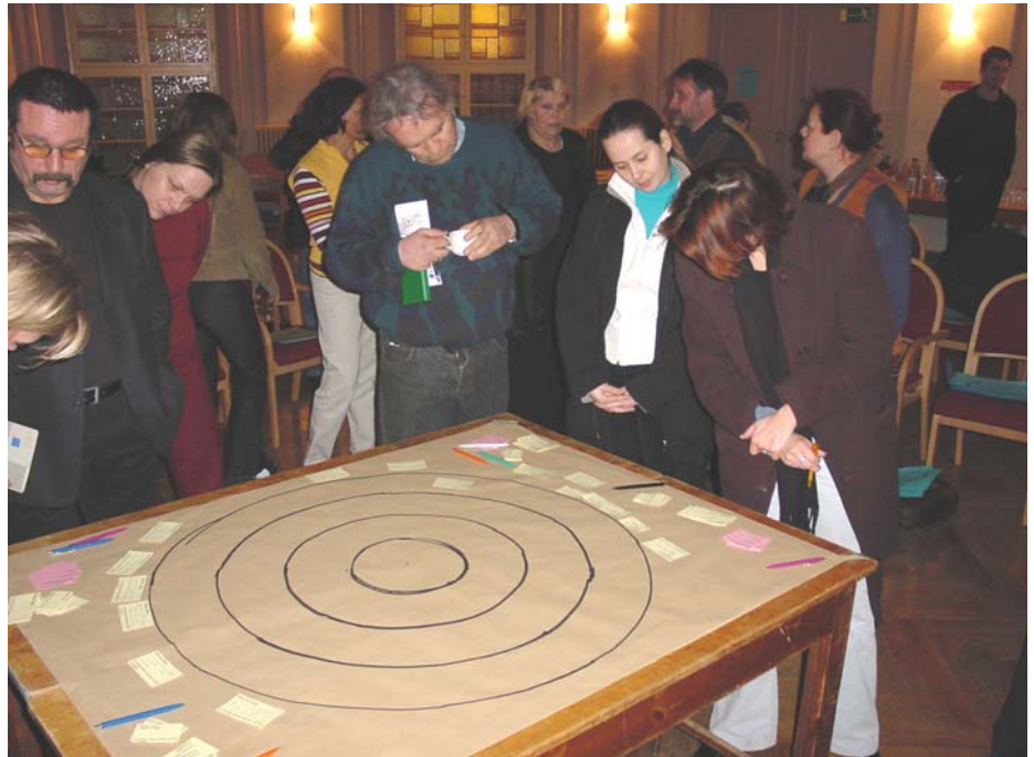
Konzentriertes Arbeiten am Ideenkreis